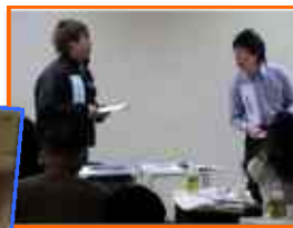
甲斐・小川の熱演による寸劇。