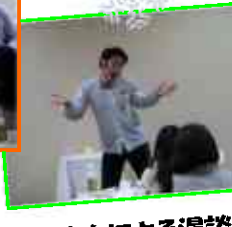
芸人さんによる漫談