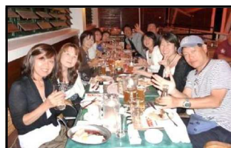
「ニューカレドニア」グループ

短い滞在時間をフルに使って、買物、エステ、食事と充実した旅行でした！マッコリも浴びるほど飲んできました（笑）