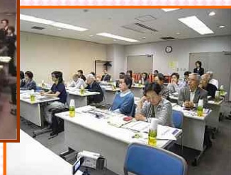
第4回セミナーの様子

* 駐車場利用に制限があり、駐車できない可能性がありますので、なるべく、公共の交通機関(電車・バス等)をご利用下さい。