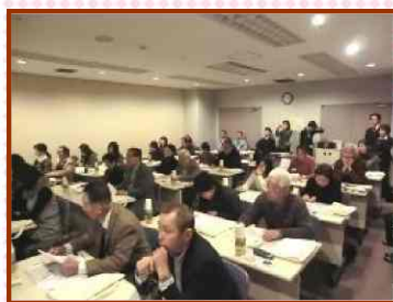
第3回セミナーの様子

賃貸仲介業も多種多様のサービス提供時代へ突入？管理委託業務とは違った側面が見えてきます！！