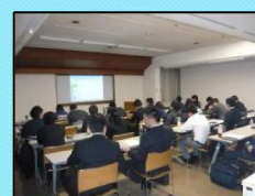
2月の営業会議も充実したものでした!