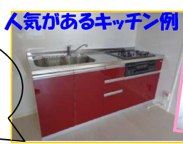
人気があるキッチン例