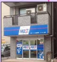
センター南店移転OPEN! 社長と向井店長(左側)