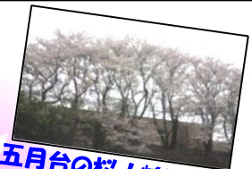
五月台の桜!