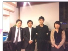
新人同期のグループです! 「桜」シリーズ