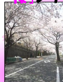
福田堤の桜!