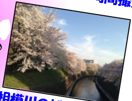
相模川の桜!