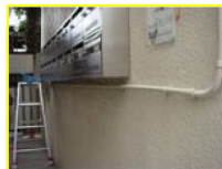
ポスト前を撮影! リアルタイムで見れる! ベランダを撮影!