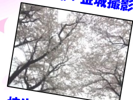
柿生の桜!