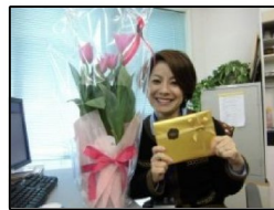
崎間●●オ?のバースデー。スタッフからのプレゼントにご満悦!