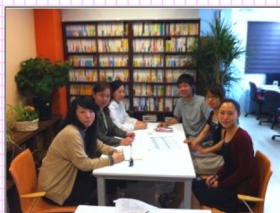
コスト削減委員会