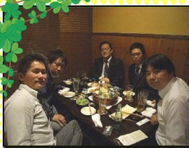
新・顧客サポート課の決起集会!!