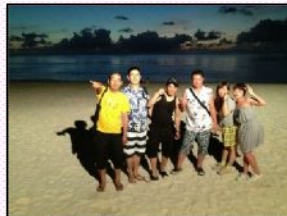
社員旅行のグアム組は海、BBQ、観光へGO！