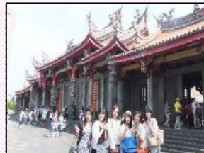
社員旅行の台湾組、市内観光へGO!!