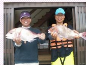
社長は大好きな釣りで大物のマダイをGET!!