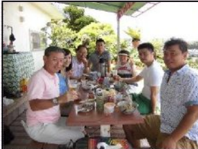
社員旅行の沖縄組は沖縄そばとオリオンビールで乾杯！