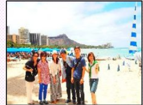
社員旅行のハワイ組は大好きな海へGO!!