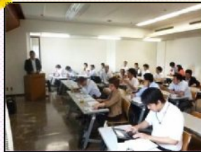
6ヶ月に一度開催される成果発表会で仲介件数や入居率、滞納率などを発表して検証をします。

6月はイベントも目白押し！大イベントの社員旅行も開催され、大いに盛り上がりました！