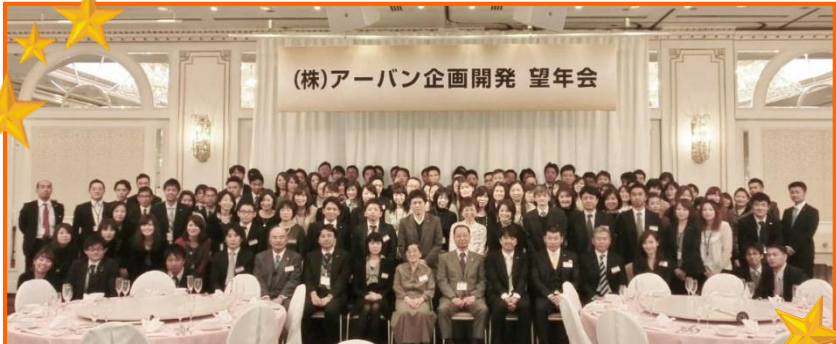
出席者全員での集合写真！ご協力ありがとうございました。

昨年の12月17日に毎年恒例の、アーバン忘年会を開催し、アーバンスタッフ及び、日頃お世話になっている顧問の先生方や、協力業者を招いて大いに盛り上がりました！