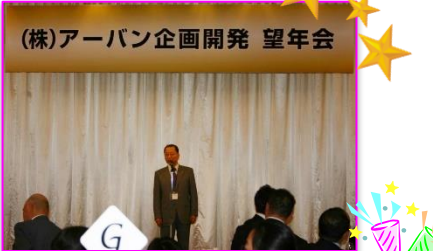
代表 三戸部の挨拶！