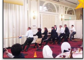
テーブル対抗の綱引きも盛り上がりました！