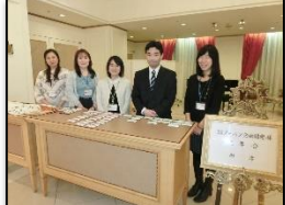
受付のメンバーさんお疲れ様でした～☆