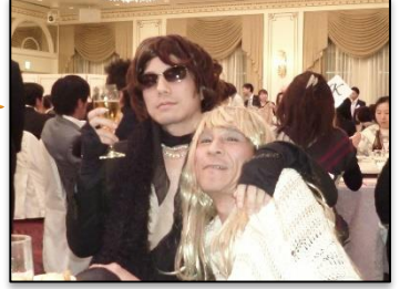
??さて、この二人は誰でしょう?! サブリース課がヒント?!