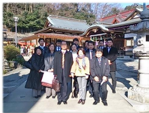
「川崎 琴平神社にて参拝」