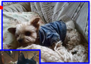
代表の三戸部の愛犬と愛猫ちゃんです！