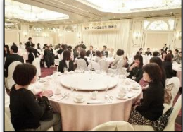
円卓で和やかに・・・！