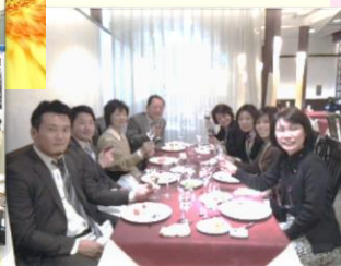
新百合ヶ丘店営業のパートさんの食事会です。みんなパワフル!の一言(^.^);