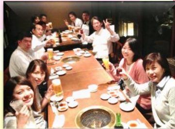
コンサルティング事業部では繁忙期に向けての決起大会を開催しました!(焼肉屋にて)