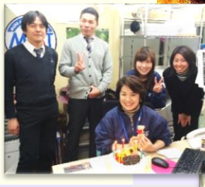
貸貸事業部、崎間の〇〇オのバースデー! みんなに祝ってもらいご満悦でした!