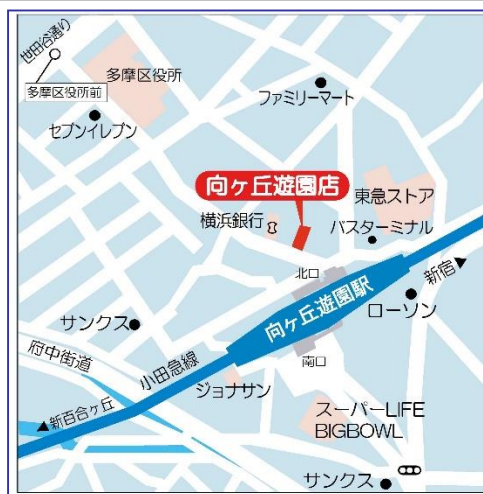
小田急線「向ヶ丘遊園」駅北口から徒歩1分

〒214-0014 川崎市多摩区登戸2092 T E L：044-932-6015 F A X：044-932-6016