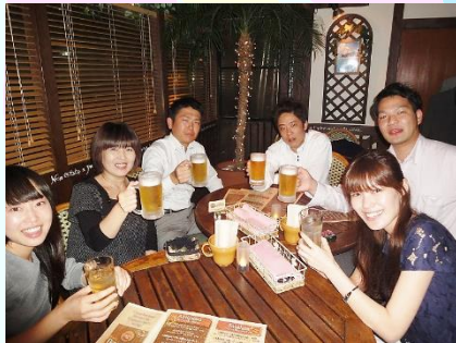
センター南店のスタッフ親睦会を開催しました。乾杯の合図を皮切りに盛り上がりました~(＾o＾)／