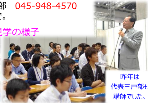
昨年(2014年)の見学の様子