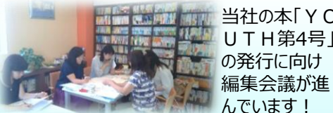
当社の本「YOUTH第4号」の発行に向け編集会議が進んでいます!