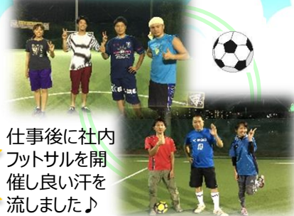
仕事後に社内フットサルを開催し良い汗を流しました♪