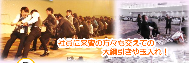
社員に来賓の方々も交えての大綱引きや玉入れ！