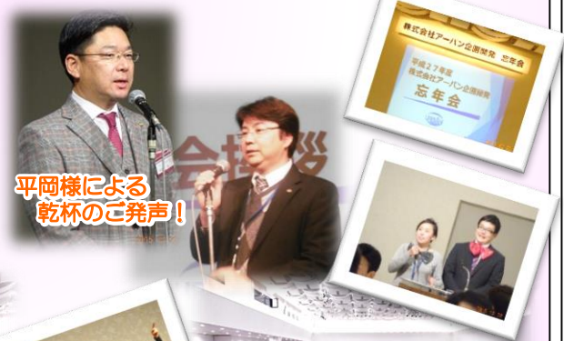
平岡様による乾杯のご発声！