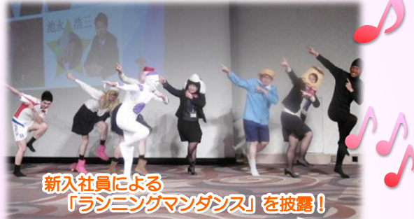
新入社員による「ランニングマンダンス」を披露！