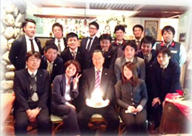
貸賃事業部は忘年会を開催し、来年に向けてみんなの結束を深めました！