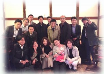
コンサルティング事業部は期末のお疲れ様会を開きました！