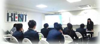
当社加盟の賃貸管理業者団体で繁忙期に向けた発表と研修があり当社からも店長クラスが参加しました！