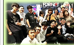
関係業者さんのご厚意でライブに招待頂き、スタッフで楽しんで来ました♪