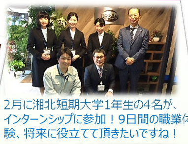
2月に湘北短期大学1年生の4名が、インターシップに参加！9日間の職業体験、将来に役立てて頂きたいですね！