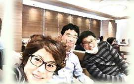
崎間・川崎・小泉は年に1回の健康診断へ。健康管理も大切なお仕事です。