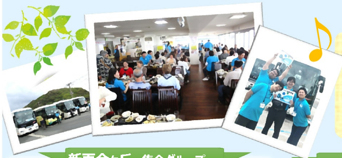
新百合ヶ丘 集合グループ