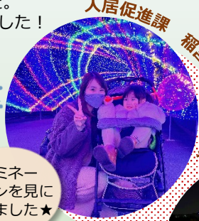
イルミネーションを見に行きました★