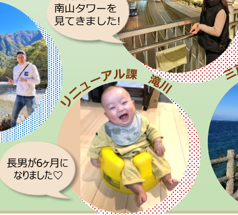
長男が6ヶ月になりました♡