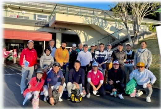
11/2にスタッフコンペを開催しました。絶好のゴルフ日和で皆で楽しんで来ました！