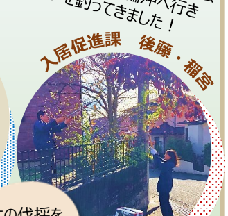
木の伐採を行いました！