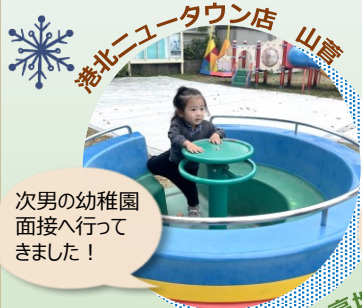
次男の幼稚園面接へ行ってきました！