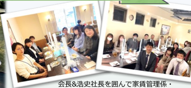
会長&浩史社長を囲んで家賃管理係・施設管理係合同の食事会を開催しました(^^)/