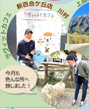
今月も色々な所へ旅しました！