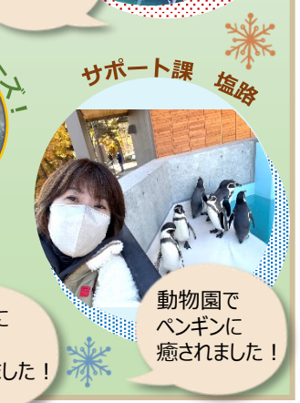
動物園でペンギンに癒されました！