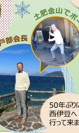
50年ぶりに西伊豆へ行って来ました！