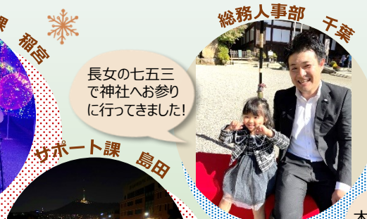
長女の七五三で神社へお参りに行ってきました！