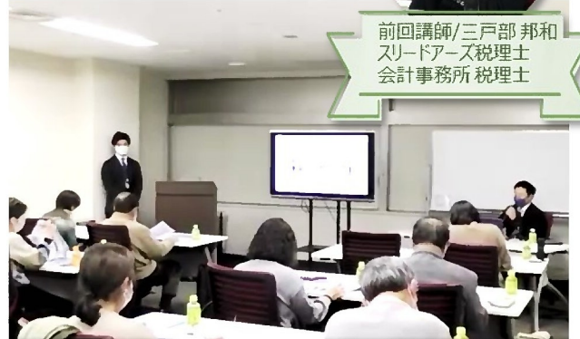
2月4日に開催した「インボイス対策セミナー」の様子