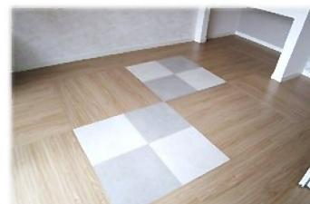
床もお洒落に演出！