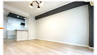
ソファと大型TVが置けるリビング