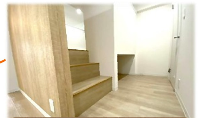
階段を作り目線を遮り°ラバシー完璧！