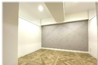
天井は低くてもベツトルームには十分です